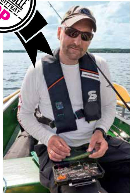
Der Autor ist von der Stinger Box absolut überzeugt

Die Box misst 19,7x11,5x5 Zentimeter und beansprucht nicht sonderlich viel Platz in der Angeltasche. Im Handel ist die – auch optisch schicke – Box in den schwarzgelben Firmenfarben der Firma Spro für rund 16 Euro zu bekommen. Eine lohnende Anschaffung für alle, die nicht nur dem Einzelhaken am Gummifisch vertrauen. Neben der vorgestellten gibt es gibt auch noch eine kleinere Ausführung. Die L-Version in Größe 16x9,5x4,7 ist für rund 14 Euro im Fachhandel erhältlich. Internet: www.spro.de